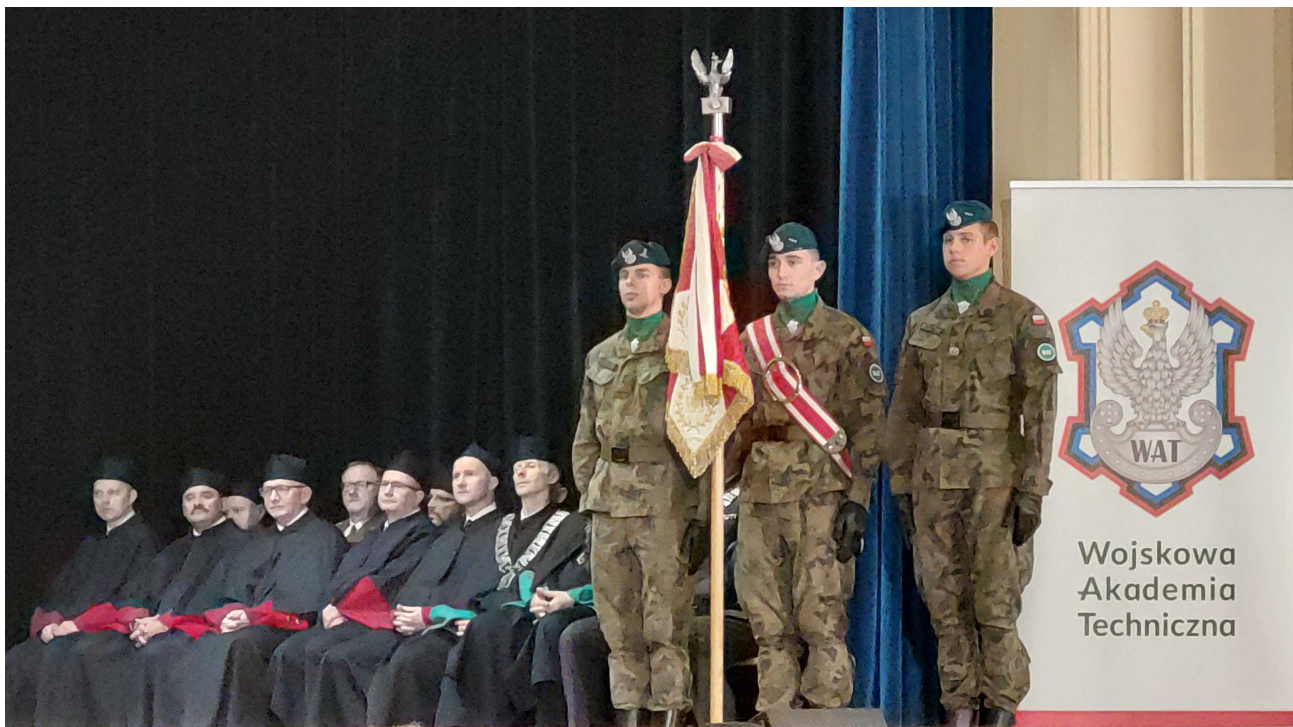
Poczet sztandarowy WAT i zaproszeni Rektorzy wyższych uczelni