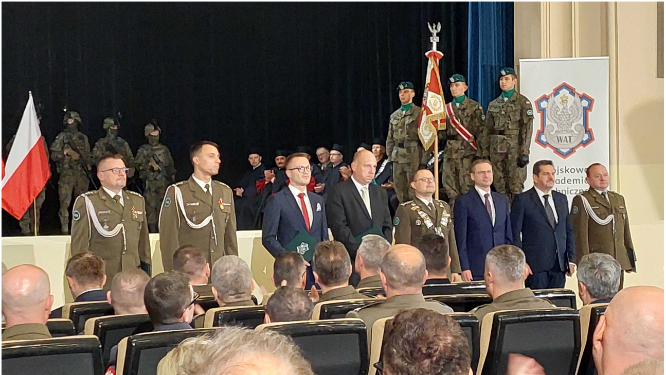
Uroczyste wręczenie dyplomów nowym doktorom habilitowanym WAT