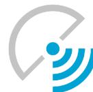
OLIMPIADA LIDERÓW TELEKOMUNIKACJI I INFORMATYKI POLTELEINFO https://polteleinfo.edu.pl

Olimpiady współfinansowane są ze środków Ministerstwa Edukacji i Nauki.