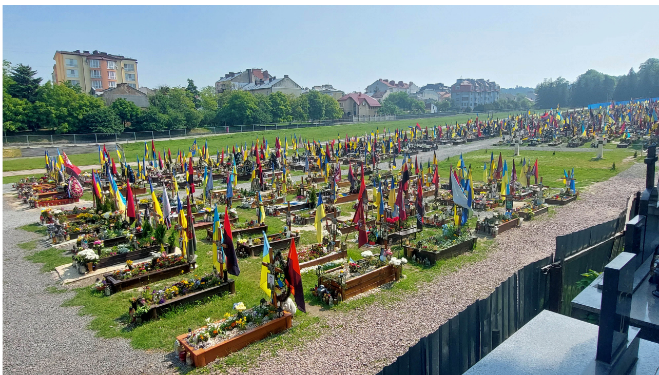
Cmentarz żołnierzy poległych w walce z rosyjską agresją na Ukrainę w latach 2022-2023