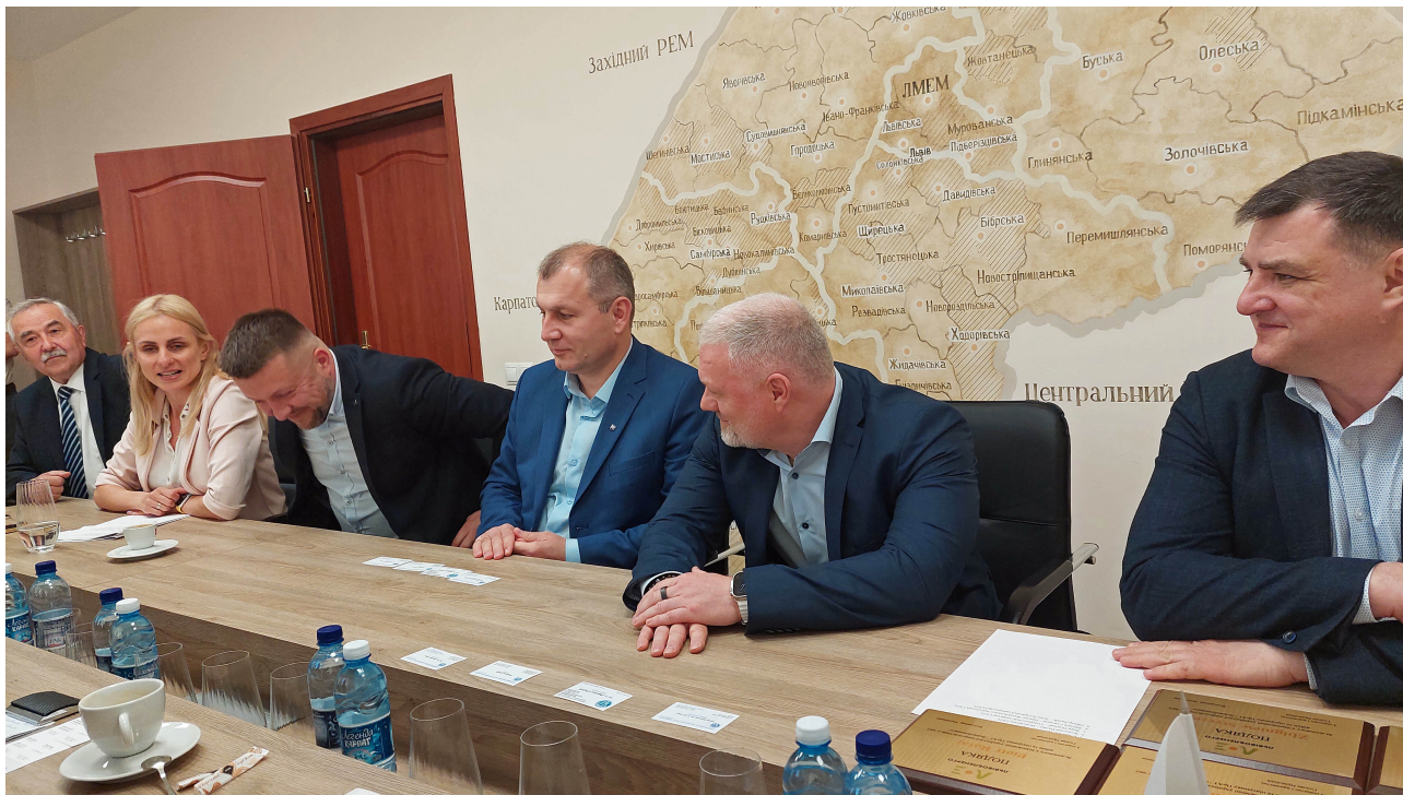
Początek spotkania delegacji SEP z kierownictwem Firmy PSA "Liwiboblenergo"