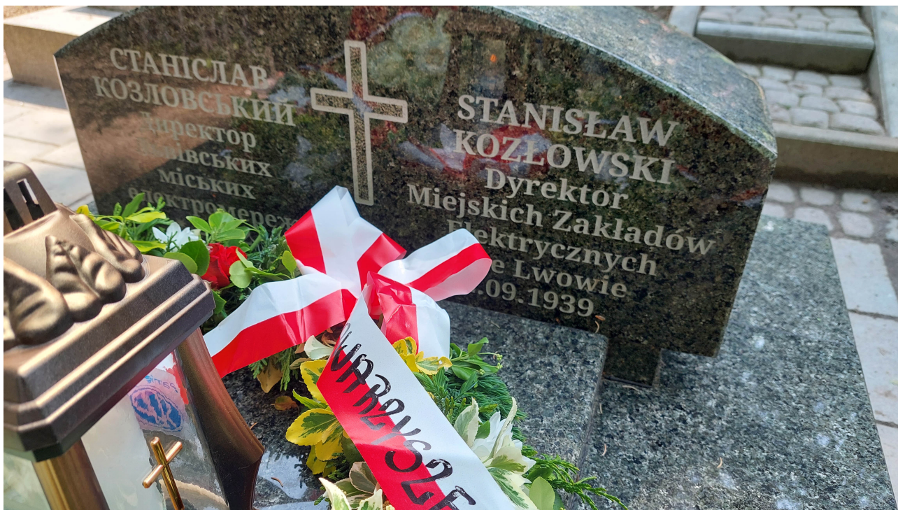
Pomnik nagrobny Stanisława Kozłowskiego ufundowało Przedsiębiorstwo PSA "Lwiwobłenergo"