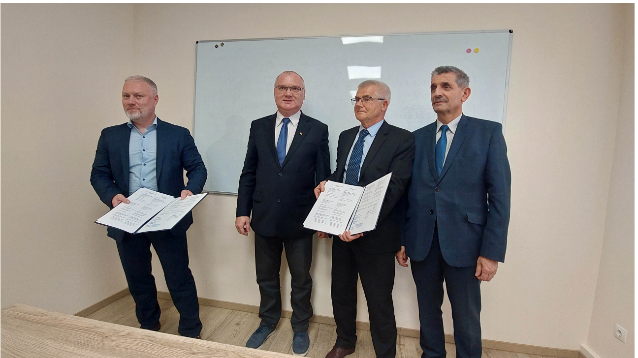
Sygnatariusze prezentuj podpisane porozumienie...