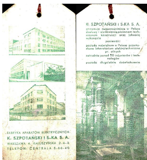
Reklama FAE K. Szpotańskiego, zakładka książki, 1938 r.

W okładce kalendarzyka była ukryta zakładka do książki, na której po obu jej stronach umieszczona była reklama największej w Polsce Fabryki Aparatów Elektrycznych Kazimierza Szpotańskiego. Wyroby FAE w latach 30-tych charakteryzowały się wysokim poziomem technicznym.